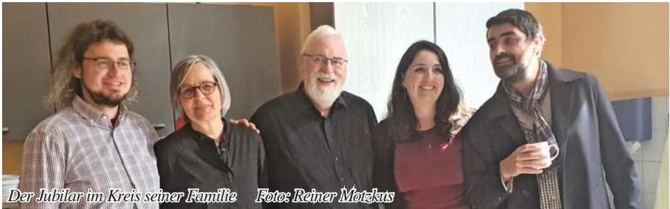
Der Jubilar im Kreis seiner Familie